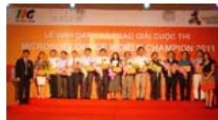
Đại diện các trường có thí sinh đạt giải nhân kỷ niệm chương của Ban tổ chức cuộc thi

Sau vòng thi Quốc gia, ngày 21 tháng 5 năm 2011, 50 em xuất sắc nhất đã chính thức tranh tài để chọn ra những gương mặt tiêu biểu tham dự vòng chung kết thế giới. Tranh tài tại vòng chung kết Quốc gia, đại diện cho khu vực miền Bắc có 13 thí sinh đến từ 9 trường đại học và THPT chuyên, trong đó đại học Hàng Hải dẫn đầu với 4 thí sinh lọt vào chung kết. Đại diện cho khu vực miền Trung có 2 thí sinh đến từ đại học Kinh tế Huế. Khu vực miền Nam vẫn dẫn đầu với 35 thí sinh đến từ 11 trường đại học và cao đẳng nghề. Trong đó đại học Ngân Hàng TP. Hồ Chí Minh vẫn tiếp tục giữ vị trí số một toàn đoàn về đội tuyển có nhiều thí sinh lọt vào vòng chung kết nhất với 8 em, xếp thứ hai là cao đẳng nghề Việt Mỹ VATC với 5 em. Đặc biệt 2 thí sinh tự do giành vé vào vòng chung kết đều đến từ Hồ Chí Minh. Như vậy, kết quả sau vòng