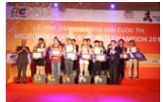
Giấy phút vinh danh cho các nhà vô địch

Cuộc thi đã kết thúc, chủ nhân của những giải thưởng đã được xác định, 10 gương mặt ưu tú đã được chọn ra để lập thành đội tuyển ôn luyện chuẩn bị kỹ lưỡng cho vòng chung kết thế giới tại Mỹ. 5 gương mặt xuất sắc đại diện cho Việt Nam tham gia vòng chung kết thế giới sẽ được Ban tổ chức tài trợ toàn bộ chi phí ăn ở và đi lại vòng chung kết thế giới tại thành phố San Diego, bang California, Hoa Kỳ. Vòng chung kết thế giới năm nay quy tụ các gương mặt xuất sắc đến từ 70 quốc