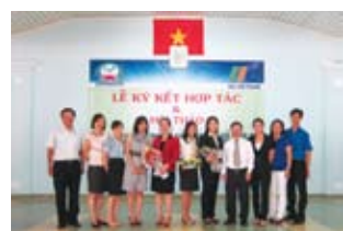
Đại diện IIG Việt Nam và CDN Đồng An chụp ảnh lưu niệm

Ngày 25 tháng 6 năm 2011, tại trường cao đẳng nghề Đồng An đã diễn ra lễ ký kết hợp tác giữa IIG Việt Nam và trường cao đẳng nghề Đồng An. Cùng ngày, Hội thảo TOEIC – Tiêu chuẩn quốc tế đánh giá trình độ tiếng Anh cũng được tổ chức nhằm giới thiệu bài thi quốc tế TOEIC tới toàn thể sinh viên của trường. Với lễ ký kết hợp tác giữa IIG Việt Nam và CDN Đồng An, sinh viên của trường giờ đây đã có thể thi lấy chứng chỉ TOEIC quốc tế ngay tại trường.