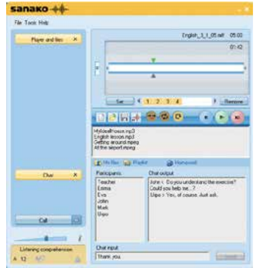
Giao diện máy học viên Sanako Study 1200

Sử dụng các công cụ giao tiếp quen thuộc với học viên như gửi tin nhắn hay chat, Sanako Study 1200 mang đến phương pháp hữu hiệu để hỗ trợ tương tác giữa giáo viên và học viên. Các công cụ hỗ trợ như bảng trắng tương tác và công cụ đánh dấu giúp học viên tham gia tích cực vào bài học.