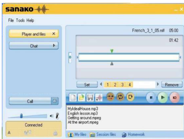
Giao diện máy học viên Sanako Study 700