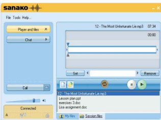
Giao diện máy học viên Study 500

Trong quá trình giảng dạy, giáo viên thường gặp khó khăn trong việc hướng học sinh tập trung vào bài học. Sanako Study đưa ra những tính năng giúp tối ưu quyền quản lý của giáo viên: Ngăn truy cập Internet, khóa bàn phím và chuột của máy học viên, kiểm soát web, xem màn hình thu nhỏ của máy học sinh... Giáo viên cũng có thể chỉ phát những chương trình cần thiết để đảm bảo học viên tập trung vào bài học.